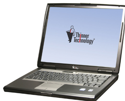
Mobiler Thin Client der VALLIS Serie

Das Schulpaket beinhaltet auch die pädagogische Oberfläche Schuladmin, mit der ein sinnvoller Einsatz von Computern im Unterricht möglich ist. Sie wird auf Wunsch von zertifizierten Systempartnern vor Ort installiert, konfiguriert und gewartet. Schuladmin ermöglicht die Verwaltung und Steuerung computergestützten Unterrichts und lässt sich von Administratoren und Lehrkräften besonders einfach bedienen. Sie können Drucker, Internetzugänge und Anwendungen sperren und freigeben. Weitere klassische Funktionen, wie Gruppenfunktion, Fernzugriff auf Bildschirme oder das Verteilen und Einsammeln von Dokumenten, sind beispielhaft zu nennen. Schuladmin profiliert sich im Vergleich zu anderen Lösungen durch eine besonders dynamische Benutzerverwaltung und Rechtevergabe. Benutzerprofile von Schülern sind nicht in Klassenverbänden fixiert. Die Jahrgangs- und Klassenzuordnung erfolgt automatisch durch Schuladmin. Eine Versetzung am Schuljahresende ist so nicht notwendig. Bei der zentralen Pflege von Benutzerkonten und -profilen helfen speziell entwickelte Programme, wie AccountKiller und ProfileKiller.