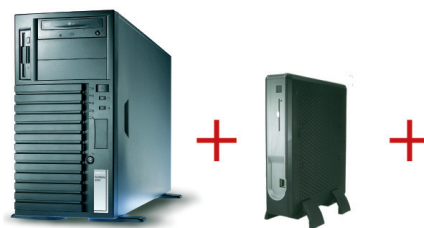
Nie wieder Turnschuhadministration durch den Einsatz von Terminal-Server, Thin-Clients und Schuladmin

Seventythree Networks bietet individuelle IT-Schullösungen und richtet den Serviceumfang an den Wünschen der Schulen aus. Je nach Bedarf können Planungs- und Beratungsleistungen sowie Anwender- und Systemschulungen gebucht werden. Neben einem Vor-Ort-Service sind auch Beratung per Hotline und Fernwartung mit garantierten Reaktionszeiten möglich.